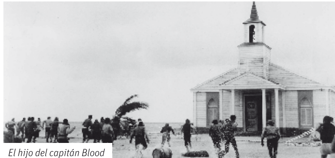
El hijo del capitán Blood

2 - LA LONJA ANTIGUA: Este edificio se convirtió en la iglesia de la ciudad de Port Royal en "El Hijo del Capitán Blood" (1961), íntegramente rodada en Dénia.