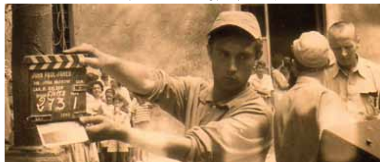
Texto y fotos: Antoni Reig y Miquel Crespo