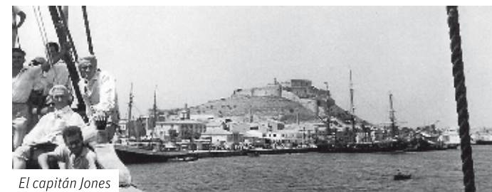
El capitán Jones

8 - EL CASTILLO: La fortaleza histórica, los rincones interiores y las grandes panorámicas desde el Castillo de Dénia han sido elementos clave en el rodaje de películas como "El hijo del capitán Blood", "El capitán Jones" y "Cervantes".