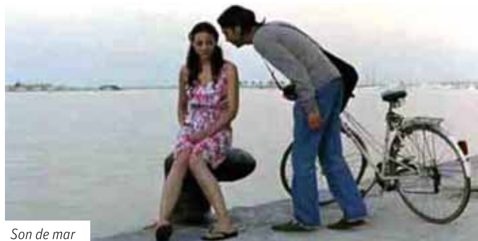
Son de mar

Ahora escoge tu película favorita, tráela a tu mente y fíjate en sus escenarios... ¡seguro que reconoces algún pedacito de esta bonita ciudad!