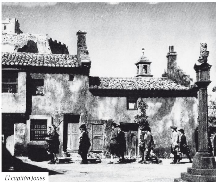
El capitán Jones

Tomen sus cámaras, ajusten el objetivo e iniciemos nuestra Ruta del Cine.